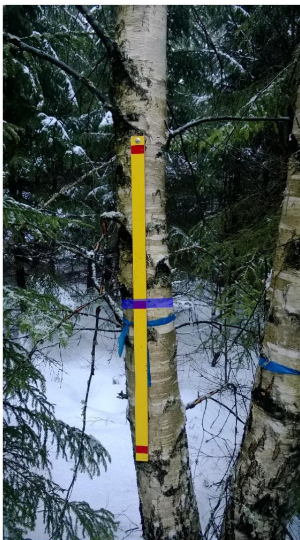
Средний диаметр (береза), 17.1 см