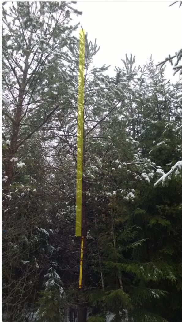
Средняя длина (сосна), 8.3 m