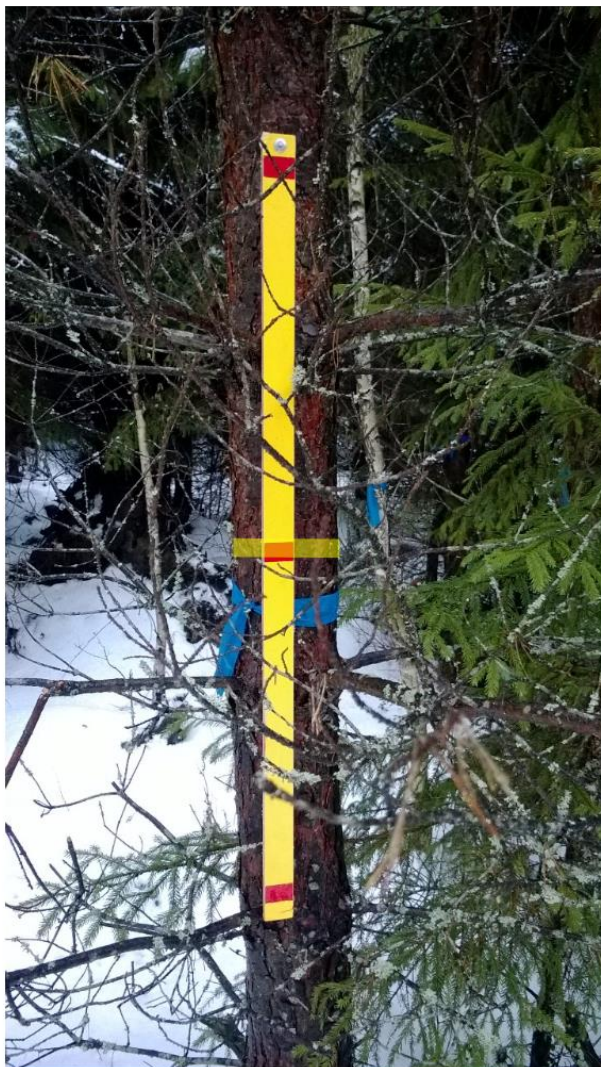
Средний диаметр (сосна), 14.7 см